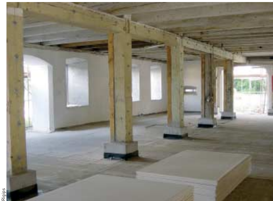
DER TROCKENBAU und die Fassadenarbeiten stehen in der neuen VOB/C von 2006 nicht mehr drin, wohl aber in der von 1996 - das hat Konsequenzen für die Höhe des Honorars der Tragwerksplaner. (Unser Foto zeigt das Rigips-System 4.45.00 für die brandschutztechnische Ertüchtigung von Altbaudecken.)